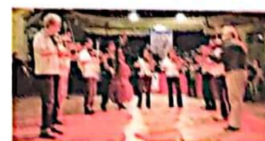
● Festa con balli e musica

L a rassegna «Chantar l'uvern - Da Natale a Sant'Orso, frammenti di cultura occitana e francoprovenzale» si chiude sabato 23 febbraio a Salbertrand con l'appuntamento «Si narra di violini in Alta Valle Susa»: un'inedita rievocazione delle feste che si celebravano negli scorsi secoli nelle borgate alpine della valle, condividendo quel poco che si aveva e